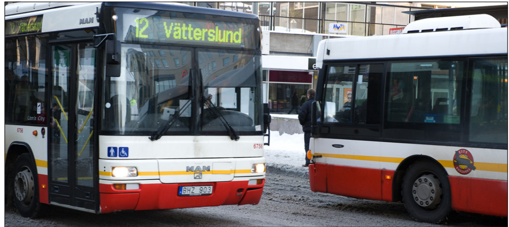
Länstrafiken har inte alls förändrats till det bättre, menar insändarskribenten.

UNDER MÅNDAG MORGEN läser jag i JP att folk är nöjda med Keolis efter en dag och detta efter en söndag. Tiderna har hållits och de nya bussarna är kanonfina.