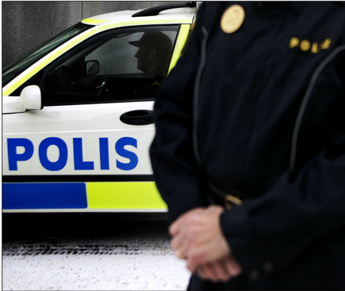
Insändarskribenten menar att polisen utför sitt arbete på ett bra sätt.